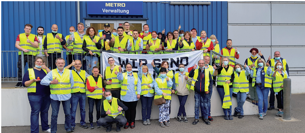
Streik bei Metro

Angesichts der pandemiebedingt schwierigen Rahmenbedingungen ist so ein für beide Seiten akzeptabler Kompromiss gelungen. Sofern die Teuerungsraten nicht völlig aus dem Ruder laufen, sollte damit Reallohnsicherung für die Beschäftigten gelingen.