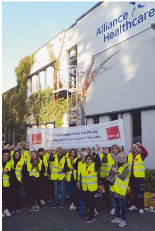
Für deutlich mehr Geld: Streik beim Frankfurter Pharmagroßhändler Alliance Healthcare Deutschland (AHD) am 23. September 2021.