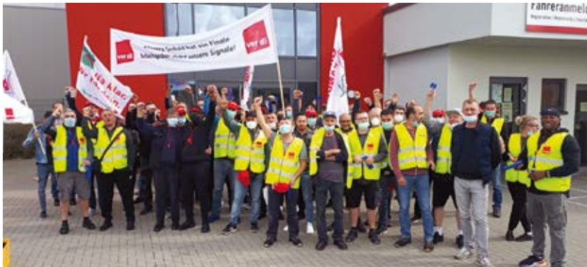
Für deutlich mehr Geld: Streik beim Rewe Logistik Zentrum, Neu Isenburg am 30. September 2021.

so haben wir es erreicht, dass es „keine“ Differenzierung und unterschiedliche Bezahlung der Beschäftigten je nach Unternehmen und Teilbranche gibt, wie es die Arbeitgeber gefordert haben. Nun bekommen „alle“ die gleiche Entgelterhöhung.