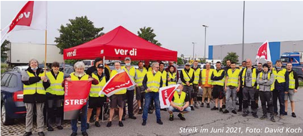
Streik im Juni 2021

Richtig, dafür gibt es keine Begründung – ausgenommen, die Arbeitgeber wollen die Krise gezielt nutzen, um die Beschäftigten zukünftig schlechter zu stellen als bisher. Denn eine Lohnerhöhung von 1,5 und 1,0 Prozent innerhalb von zwei Jahren bedeutet bei der zu erwartenden Preissteigerungsrate von 2,5 bis 3,0 Prozent in jedem Jahr eine dauerhafte Senkung der Kaufkraft der Nettoeinkommen. Das gilt es zu verhindern – durch Aufklärung aller Kolleg*innen, betriebliche Aktionen und Streiks.