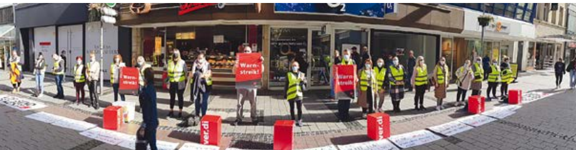
Streik- und Aktionstag 22. September 2021