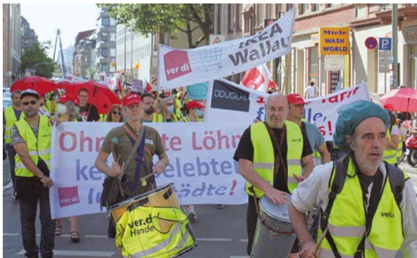
Streik- und Aktionstag im hessischen Einzel- und Versandhandel am 7. Juli 2021 in Frankfurt.

Die Ausbildungsvergütungen werden in jedem der beiden Tarifjahre und in jedem der Ausbildungsjahre durchschnittlich um 30 Euro erhöht; das ist eine Steigerung zwischen 2,5 und 3,0 Prozent.