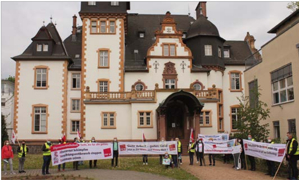
Protest vor der Unternehmer-Villa: Betriebsräte aus dem Einzelhandel vor dem Verhandlungslokal der Tarifverhandlung am 12. Mai 2021 in Frankfurt