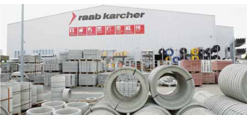
Bei Raab Karcher und den anderen Branchengrößen machten sich die staatlichen Förderprogramme im vergangenen Jahr stark bemerkbar