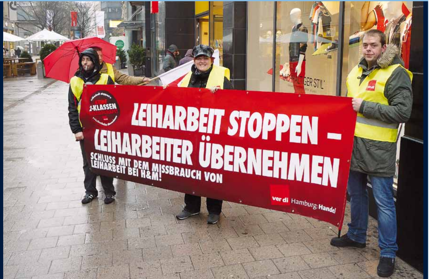
Vor der Deutschland-Zentrale der Modekette H&M in Hamburg demonstrierten am 5. Februar Betriebsräte und die ver.di-Betriebsgruppe der H&M-Logistik in Neuallermöhe gegen den Missbrauch von Leiharbeit und für gleiche Entlohnung der Leiharbeitskräfte. Inzwischen hat die Geschäftsführung mit dem Betriebsrat eine Reduzierung der Leiharbeit vereinbart. ver.di spricht von einem ersten positiven Schritt, dem weitere folgen müssen. Auch am Lagerstandort Großostheim fand im Februar eine ver.di-Aktion für gleiche Bezahlung und Stopp der Leiharbeit statt.

Herausgeber: Margret Mönig-Raane, Frank Bsirske, Bundesvorstand Vereinte Dienstleistungsgewerkschaft (ver.di), Paula-Thiede-Ufer 10, 10179 Berlin, 0 30-69 56-0 Redaktion & Gestaltung: Andreas Hamann, Claudia Sikora, bleifrei Texte + Grafik, Prinzessinnenstraße 30, 10969 Berlin, Tel. 0 30-61 39 36-0, Fax: 0 30-61 39 36 18, E-Mail: info@bleifrei-berlin.de Druck & Vertrieb: alpha print medien AG