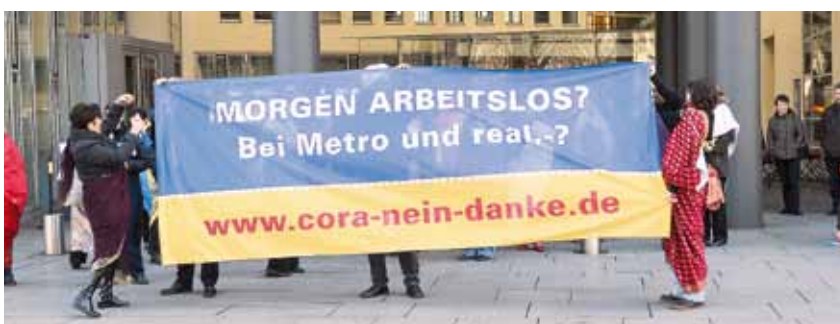
Düsseldorf Anfang März: Aktion gegen das Projekt Cora

Für den real,-Standort kamen mit 120 Beschäftigten würde die Umsetzung des Projektes die Schließung bedeuten. Darauf haben die Betriebsratsvorsitzenden von Metro C&C, Metro AG und real,-SB