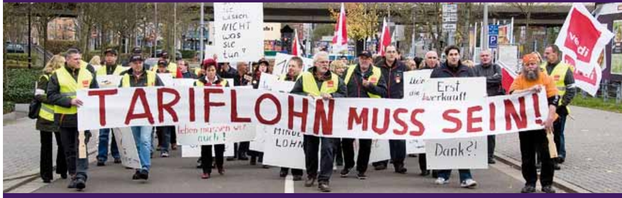
Demonstration in der Saarbrücker Innenstadt