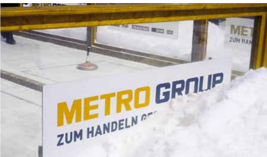
Das soziale Klima im Metro-Konzern kühlt sich ab