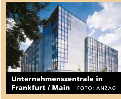
Unternehmenszentrale in Frankfurt / Main

► ANZAG LEGT ZU: Der Pharmagroßhändler Andreae-Noris Zahn AG (ANZAG) hat im 1. Halbjahr seines Geschäftsjahres 2010 Umsatz und Ergebnis im Vergleich zu 2009 gesteigert. Die Konzernumsatzerlöse stiegen um 5,8 Prozent auf 2,1 Mrd. Euro. Das Ergebnis vor Ertragssteuern (EBT) nahm um 4,0 Mio. Euro auf 22,2 Mio. Euro zu.