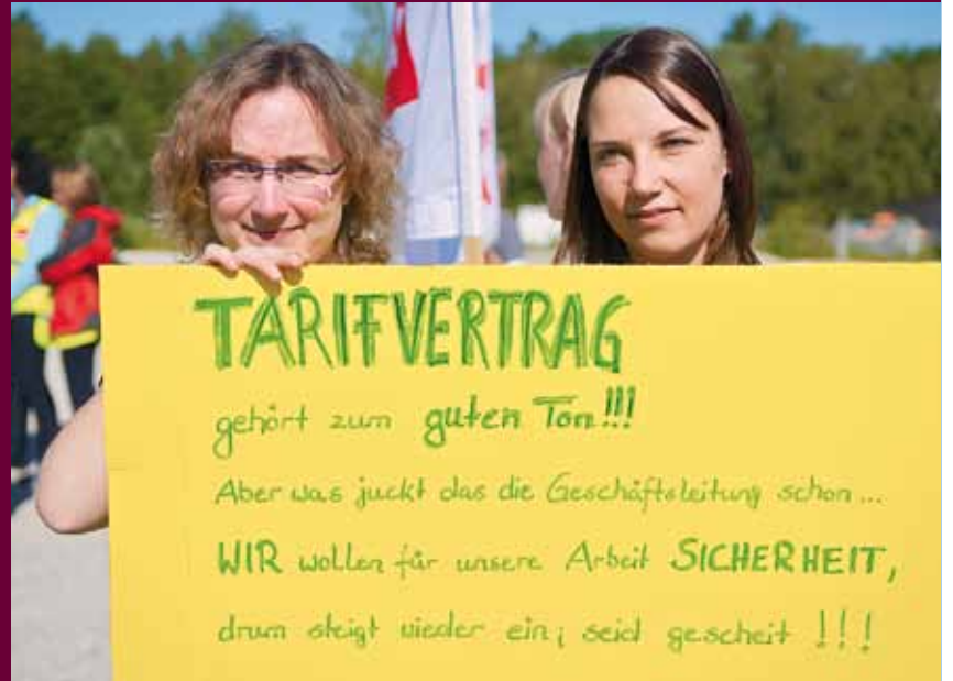
Demonstration in Rain am Lech als Auftakt für mehrtägige Dehner-Streiks an verschiedenen Standorten in Bayern. Vor der Unternehmenszentrale kam es zu einer Kundgebung