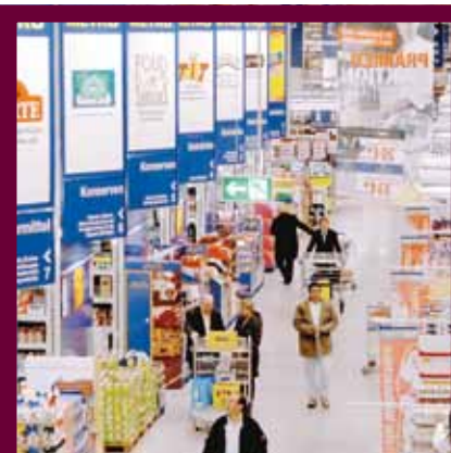
1985 wurde das Spiel »Cash & Carry« konzipiert. Damals schien die Welt noch in Ordnung. Insbesondere in den letzten Jahren kommt es immer wieder zu Umstrukturierungen und es wird Personal abgebaut

Mittlerweile haben eine ganze Reihe an Veranstaltungen und Verabredungen zur Abwehr des ungebremsen Abbaus