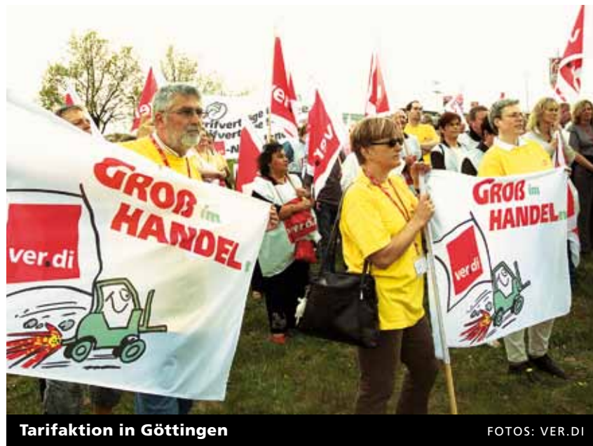
Tarifaaktion in Göttingen