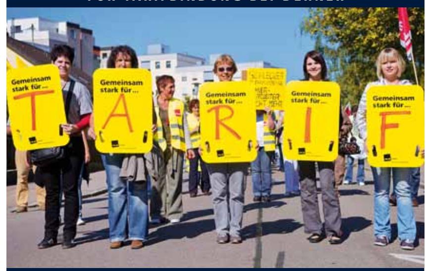
Beschäftigte der Garten-Center in Bayern und vom Zentrallager streikten ab 23. Juni (Siehe Seite 4)