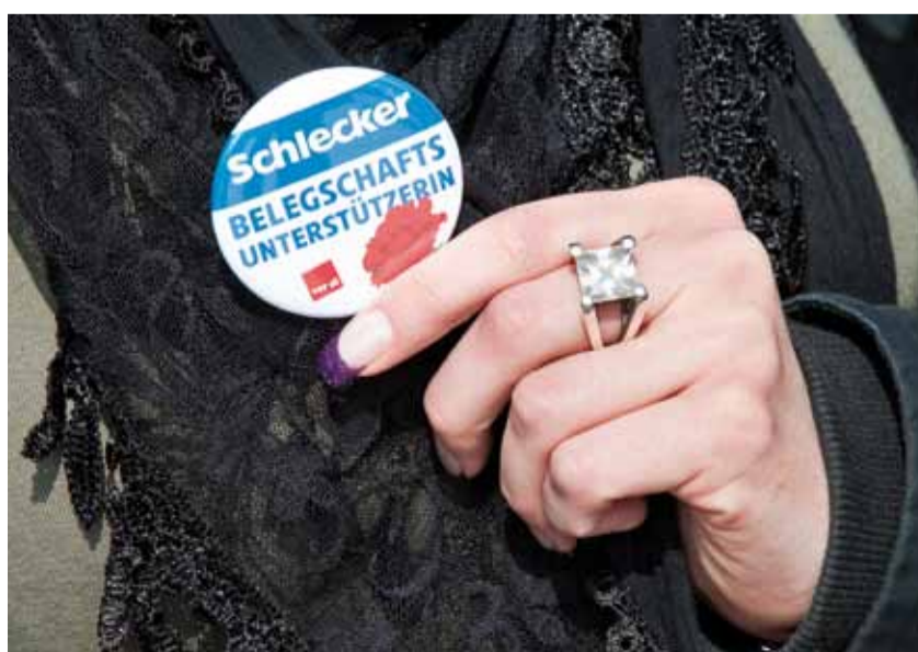
Ein in diesen Tagen viel getragener Solidaritätsbutton