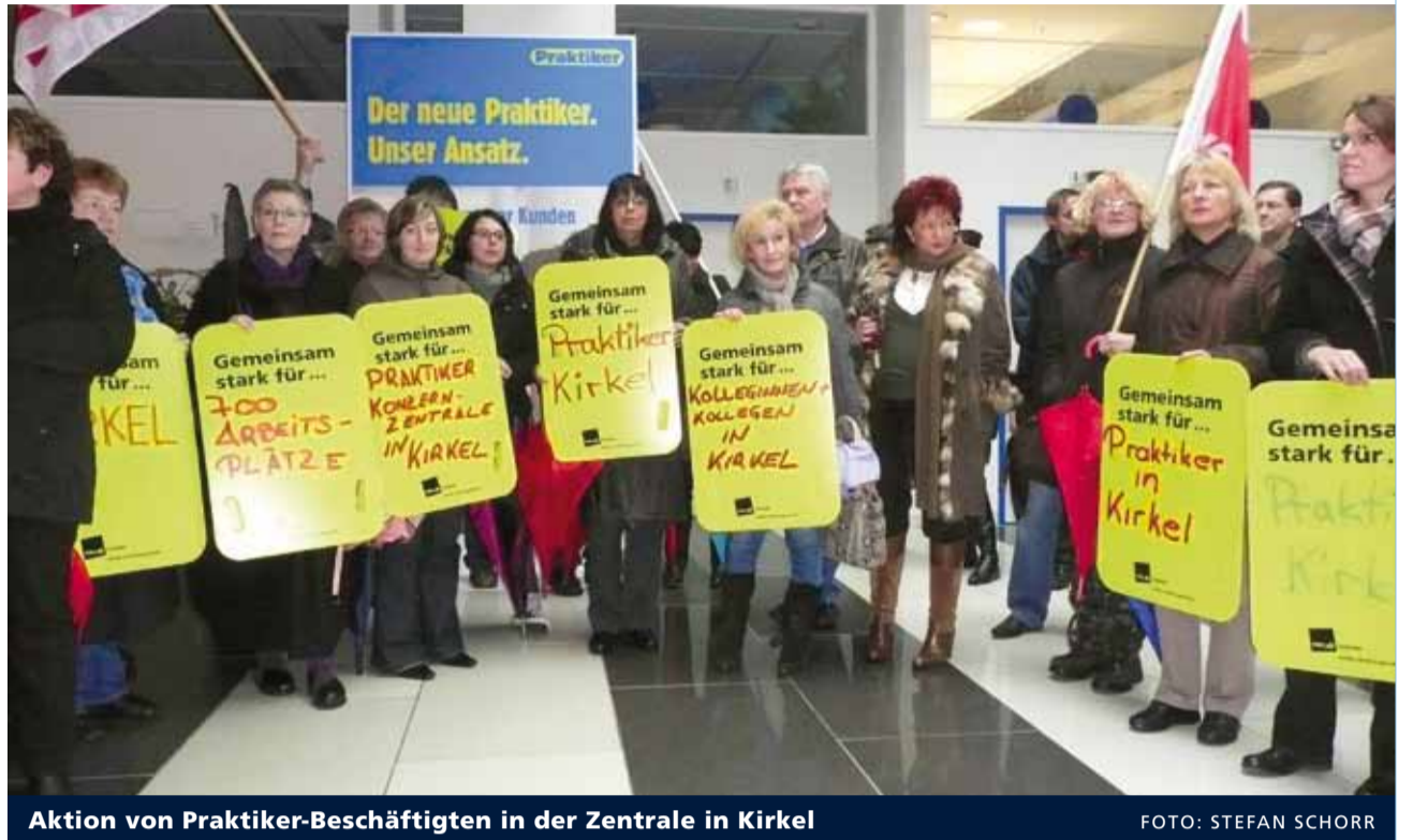
Aktion von Praktiker-Beschäftigten in der Zentrale in Kirkel

Unterdessen setzt die Konzernspitze ihr Restrukturierungs- und Sanierungskonzept um und trifft dabei zum Teil auf deutliche Widerstände. Begonnen hat der Umzug der Firmenzentrale von Kirkel im Saarland nach Hamburg zur profitablen Tochter Max Bahr. Die auch von ver.di und dem saarländischen Landesparlament heftig kritisierte Maßnahme soll im Herbst vollzogen sein. Auf Ablehnung stößt insbesondere der damit verbundene Personalabbau. Wie berichtet, könnten durch das Restrukturierungskonzept insgesamt etwa 2.000