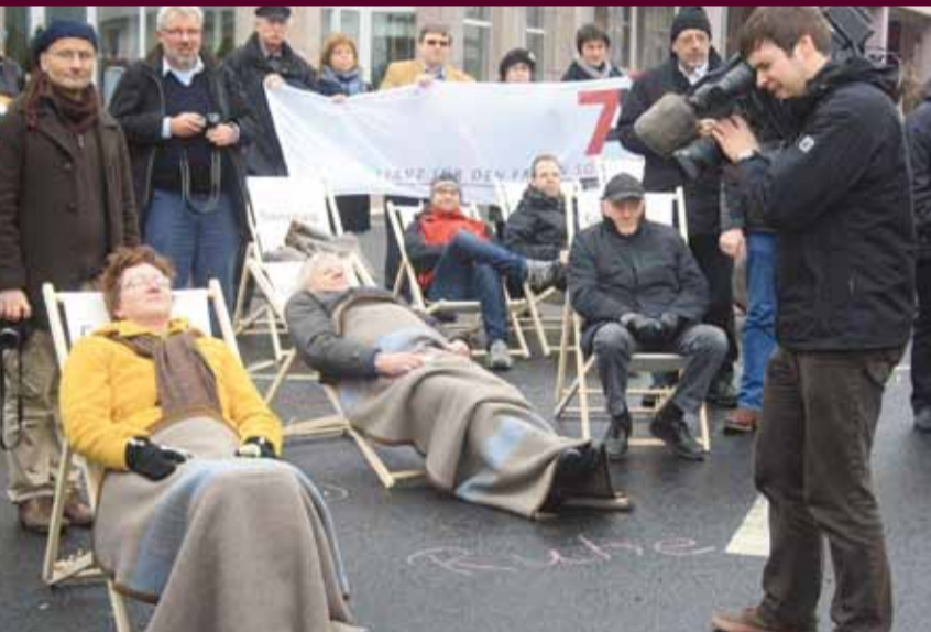
Mit einem »Ruhe-Mob« auf einer der verkehrsreichsten Kreuzungen Fuldas sorgten die Sonntagsaktivisten für Aufmerksamkeit

Die Allianz für den freien Sonntag ist in mittlerweile acht Bundesländern und ca. 80 Regionen in Deutschland aktiv. Seit 2011 gibt es auch eine »European Sunday Alliance«. AHA