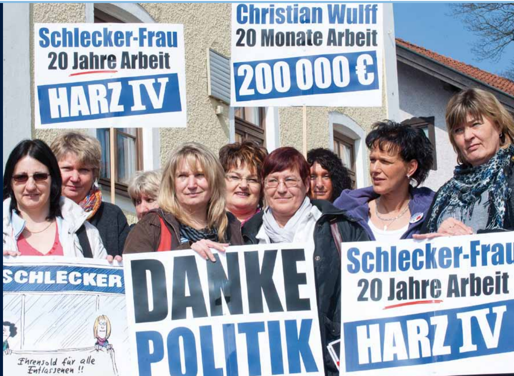
Schlecker-Verkaufsbezirk Pfarrkirchen (Bayern): Protest gegen Schließungen und Kündigungen